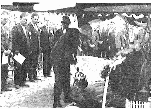
鉄入れを行なう東京第一電気工事局長