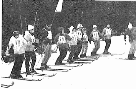
写真は昨年のスキー教室風景

スノーボード教室の一環として次のとおりスキー教室を開催いたします。一人でも気軽にはご家族連れでもお気軽に参加ください。 ▼人員 A班 B班各四十名(先着順、定員になり次第締め切ります) ▼会費 六千円(宿泊費、交通費、コーチ料、諸雑費含む) ▼資格 市内に在住、在学、在勤のもの ▼コース 初心者、初級、中級、上級、四コース ▼申し込み先 教育委員会社会教育課 ▼場所 新潟県苗場スキー場 ▼期日 A班一月十九日(夜) B班二月二日(夜行)五日(各全曜夜土日月)