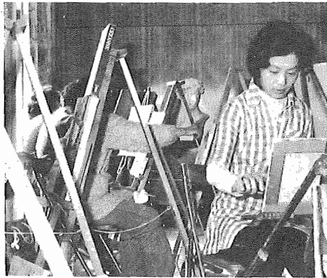
ここはこうよ...と楽しい一日(絵画教室)

日ばしかという名前ですま されていいますが、3日ば しかは、風疹のものではあ りません。 1・2歳頃の3日ばしか は、だいたいが突発性発疹 という病気で、 ◎風疹の症状 熱が少し出て、それと一 緒に発疹が顔にあらわれ、 全身に広がっていきます。 はしかよりも細かい発疹で ピンクがかつた赤い発疹が 出て、普通は3日くらいで 消えてしまふ。大人がかか ると少し重く、関節痛など もありまふ。小学校高学年 から中学生、高校生という 年代がかかりやすい時期で す。 ◎先天性風疹症候群 妊婦初期に風疹にかか ると、白内障、心臓奇形、難 聴など3つの異常を持った 先天異常児が生まれる事 があり、風疹という病気が問 題にされています。 ◎妊娠とワクチン 日本内地の8割の妊婦は 安心です。生ワクチンなので、