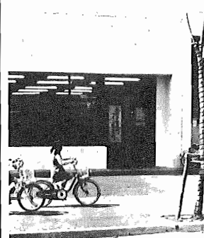
▲4月1日にオープンしたつくし野支所