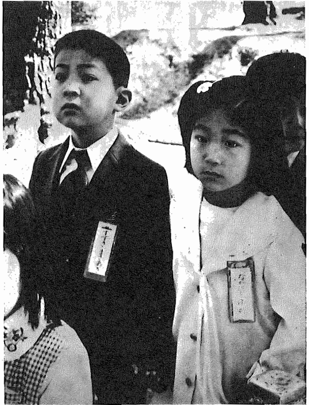
▲ちよっと緊張しちゃうな(第1小学校)

位置 つくし野824番地 定員 100名 ※保育手当支給条例の一部を改正する条例の制定 前年度分所得課税額が30000円未満の世帯へ1万円、前年度分所得課税額が30000円以上の世帯へ6000円と手当支給額が引き上げになりました。 ※世帯更生貸付金貸付に関する条例等を廃止する条例の制定 世帯更生貸付金貸付に関する条例、世帯更生貸付金貸付の設置・管理と処分に関する条例を廃止し、社会福祉協議会で行う善意銀行福祉資金貸付制度が充実されたのでこれに代わるものとします。 ※国民健康保険条例の一部を改正する条例の制定 医療費の改定に伴う経済情勢を考慮、助産費を6万円、葬祭費を2万円にそれぞれ引き上げます。 ※市民交通災害見舞金支給条例の一部を改正する条例の制定 交通事故による傷害の治療期間が3か月未満のものに対し、見舞金を引き上げます。 ※中小企業資金融資条例の一部を改正する条例の制定 経済情勢の変動に対応するため融資窓口の拡大と貸付限度額の引き上げを行いました。 ※下水道条例の一部を改正する条例の制定 泉地区の居表示が行われたため、処理区の名称変更と、新たにつくし野地区の一部を久米家処理区に加えました。 ※財産の取得 学校用地として次のとおり取得しました。 第2小学校用地 約9278㎡ 布佐小学校用地 約6061㎡ ※市道路線の認定と廃止 都市化が進み道路の新設、廃止