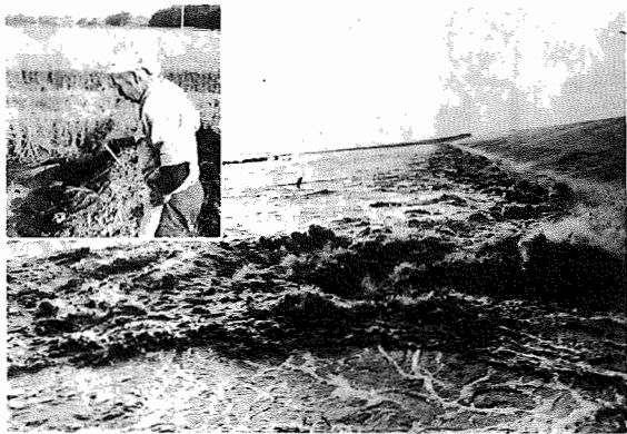
▲越流堤を越えて北新田に流れ込む濁流。農家の表情も暗い

わたしたちは、利根川と手賀沼にかこまれ自然と歴史には くまれた我孫子の市民です。 わたしたちは、田園教育文化都市をめざす市民としての誇 りをもち、明日への願いをこめて、ここに市民憲章を定めます。 水と緑と土のおいがいっぱい 住みよいあびこにします 心と体をきたえ 生き生きと働き 伸びゆくあびこにします 老人を大切に 子どもの夢を育て 幸せなあびこにします ふるさとを愛し 文化を高め 豊かなあびこにします みんなで話しあい きまりを守り 明るなあびこにします