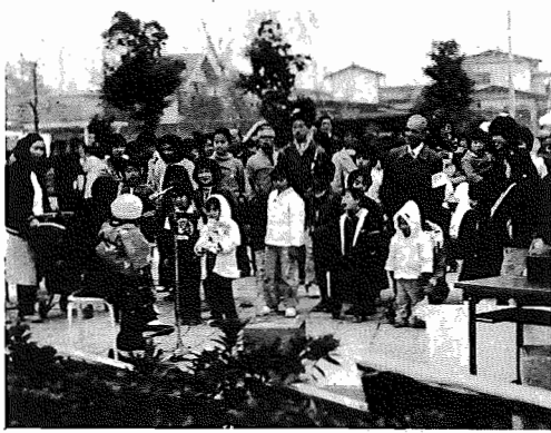
▲腹話術を楽しむみなさん=去年の福祉まつりから=

8月29日(日)中央公民館でふるってご参加を 国際障害者も二年目を迎えますが、障害者のみならず健常者にとってもこれから「障害者運動」の本番、といえます。 市の福祉団体は八月二十九日(日)に第三回「あびこ福祉まつり」を中央公民館で午前十時から午後四時まで催します。二年前、福祉作業所の呼びかけで、第一回目が映画 講演を中心に、そして