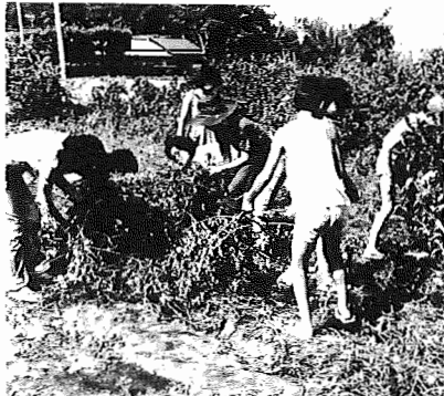
▲自給村を考える会では8月の初め、子どもたちを対象に農場合宿を行った。