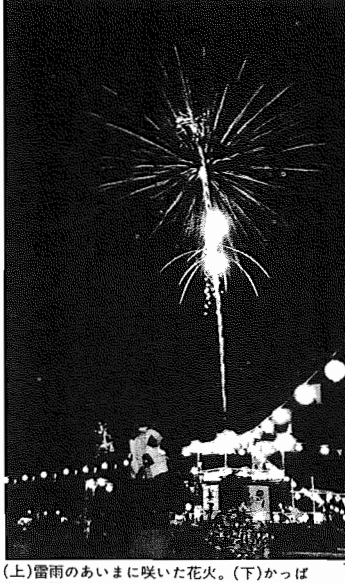
(上)雷雨のあいまいに咲いた花火。(下)かっぱ音頭を踊るみなさん。あびこあれこれ

かっぱ音頭に花火に たくさんの人出が —手賀沼市民まつり前半の部— 8月7日、8日と手賀沼市民まつり前半の部が行われ、たくさんのかっぱ音頭、浴衣姿もあふれ、お母さんたちにも、チビッコたちも負けじと浴衣姿のなかで、スターマインや水中花火に集まった大観衆のあちこちから歓声があがりました。