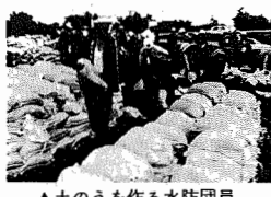
▲土のうを作る水防団員

八月一日、二日にかけて関東、中部地方を襲った台風十号の影響で利根川が増水。市内青山の越流堤からは二日から一昼夜にわたって濁流が北新田に流れ込みました。このため金谷水門は八日まで閉鎖、一時は避難勧告も出されるなど、市民生活に大きな影響を及ぼしました。 入り入れを目前にまたも： 秋の入り入れを目前に、今年も北新田の田畑は濁流にのみまれました。北新田は、利根川が著しく増水したため、本堤防より低い、越流堤(約四百五十丁)から水が流れ込む仕組となつて、越流堤完成以来四度目という今回の越流。冠水に我孫子と柏市にまたがれたために、北新田と天王台や、また水稲も開花期という時期の悪きも重なり、被害額は昨年を上回るものと予想されています。が異常に高まり、市では開きま