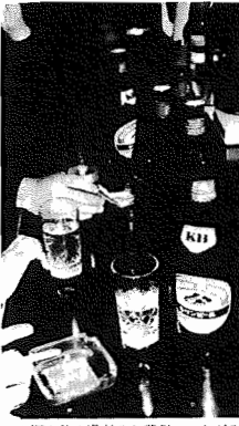
酒も飲み過ぎると悲劇につながる