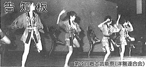
第4回郷土芸能祭(洋舞連合会)

12月1日現在 (対前年比) *人口 109,413人(+2,309人) 男 54,844人 女 54,569人 *世帯数 32,857世帯(+1,049世帯) ●市役所本庁 85-1111 ●市民会館 84-3311 ●つくし野支所 84-8801 ●市民図書館 84-1110 ●湖北支所 88-0828 ●市民図書館湖北台分館 87-3055 ●湖北支所 88-2111 ●つっじ荘 88-0123 ●布佐支所 89-2358 ●都市改造事務所 85-1171 ●教育委員会 85-1151 ●中央公民館 82-0515 ●水道局 84-0111 ●身体障害者福祉センター 88-0141 ●消防署 84-0119 ●生活環境課(浄化槽) 87-2379 ●社会教育課 85-1511 (ゴミ)87-0015 (し尿)88-2547 ●市史編さん室 85-2481 ●保健センター 87-1131