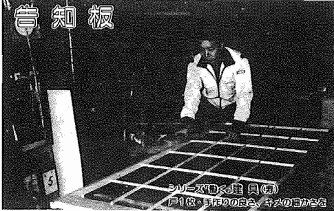
「あひこ」の職員(左)戸別・手帳の回収、キチの回収

昭和60年4月1日現在 (対前年比) *人口 110,801人(+1,429人) 男 55,398人 女 55,403人 *世帯数 33,334世帯(+517世帯) ●市役所本庁 85-1111 ●つくし野支所 84-8801 ●湖北支所 88-0828 ●湖北支所 88-2111 ●布佐支所 89-2358 ●教育委員会 85-1151 ●水道局 84-0111 ●消防署 84-0119 ●少年センター 85-1514 ●市史綱とん室 85-2481 ●保健センター 87-1131 ●市民会館 84-3311 ●市民図書館 84-1110 ●市民図書館湖北分館 87-3055 ●市民図書館移動図書館 87-0909 ●中央公民館 82-0515 ●都市改造事務所 85-1171 ●身体障害者福祉センター 88-0141 ●つつし荘 88-0123 ●生活環境課(浄化槽) 87-2379 (ゴミ)87-0015 (し尿)88-2547