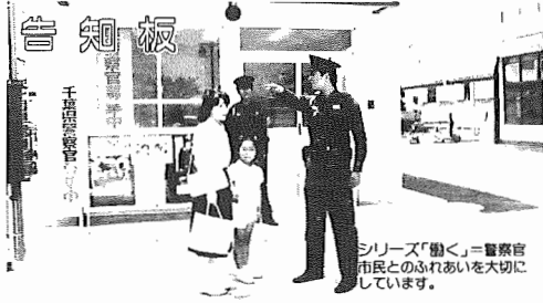
シリーズ「働く」=警察官 市民とのふれあいを大切に しています。