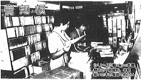
シリアズな働く本館 来店の時間帯、早朝 遅い本の整理に忙しい

昭和61年9月1日現在 (対前年比) ●市役所本庁 85-1111 ●つくし野支所 84-8801 ●湖北台支所 88-0828 ●湖北支所 88-2111 ●市佐支所 89-2358 ●教育委員会 85-1151 ●水道局 84-0111 ●消防署 84-0119 ●少年センター 84-1900 ●市史編さん室 85-2481 ●保健センター 87-1131 ●市民会館 84-3311 ●市民図書館 84-1110 ●市民図書館湖北台分館 87-3056 ●市民図書館移動図書館 87-0909 ●中央公民館 82-0515 ●市民体育館 87-1155 ●都市改造事務所 85-1171 ●身体障害者福祉センター 88-0141 ●つつし荘 88-0123 ●生活環境課(浄化槽) 87-2379 ●(ゴミ)87-0015 (し尿)88-2547