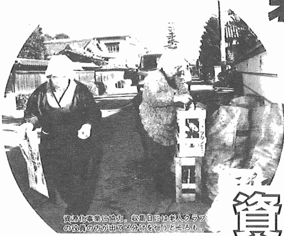
資源化事業に協力、収集日には宅からクラブの役員の方が出て区分けを行うところも。