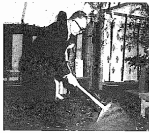
市長による鉄入れ—起工式で—