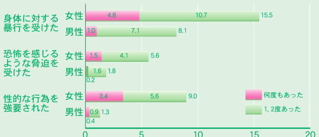
配偶者等からの被害経験（複数回答）

配偶者等親しい間柄からの暴力をいいます。「配偶者からの暴力の防止と被害者の保護に関する法律」（DV防止法2001年施行、2004年改正）では、内縁、離婚後の暴力の継続、恋人、同性カップルも含まれます。どんな行為がDVかという、監視したり脅したりして相手を孤立化させること、経済的なコントロールをすること、心理的、性的、身体的な、継続的虐待がそれにあたり、命の危険を感じている人も多いのです。