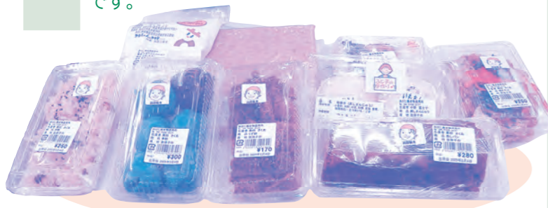
加工部会の自慢の品々