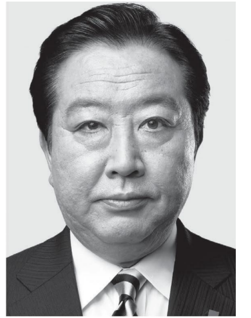
立憲民主党 代表 野田佳彦