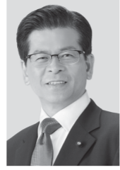
公明党代表 石井啓一

小さな声を聴く力、粘り強い政策実現力、国と地方をつなぐ力—— こうした公明党の堅実な力で、未来につながる改革を進めます。