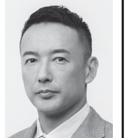
れいわ新選組 代表 山本太郎