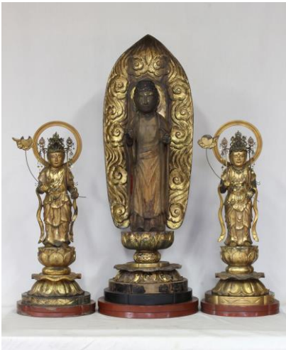
薬師三尊像（修復後）