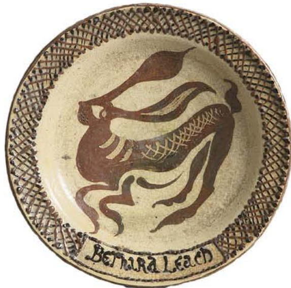
上：バーナード・リーチ「素焼駆兔文皿」我孫子時代（日本民藝館蔵） 左：リーチの仕事場（式場隆三郎『バーナード・リーチ』より）