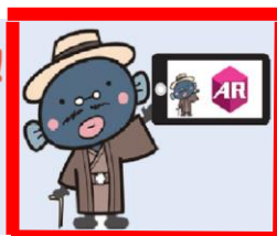
（うなきちさんARフォトフレーム）

スマホ・タブレット用無料ARアプリ「COCOAR」で、右のうなきちさんをスキャンすると、オリジナルフォトフレームがダウンロードできます！