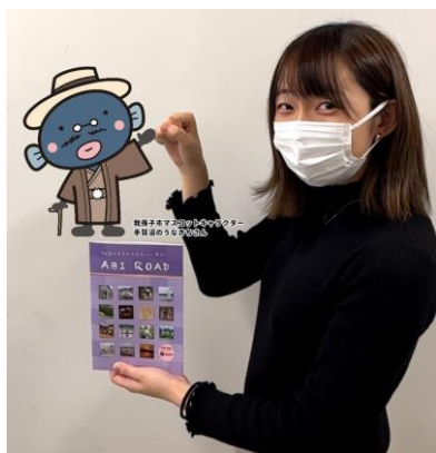
△うなきちさんARフォトフレームで撮影

■配布場所：市役所本庁、我孫子駅前アビシルベ、市内3博物館（白樺文学館・杉村楚人冠記念館）、水の館、市内宿泊施設、千葉銀行（市内3支店）ほか