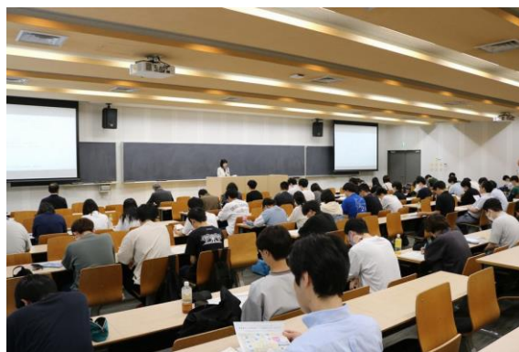
6月13日に中央学院大学で事前説明会を実施

応募のあった提案については、学内審査を経て、11月23日（土）に施策提案発表会を実施し、優秀な作品については表彰を行い、事業を検討します。