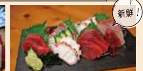
ちようちん 3点盛り