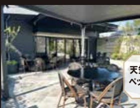
天気の良い日はペットと食事もO