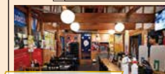
ドラマ「買の戦争」ロケ地

千葉県我孫子市南新木 3-10-1 04-7187-5155 水曜定休日 17:00～23:00 (L.O. 21:30 焼き鳥 / 22:00 フード / 22:30 ドリンク)