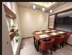
プライベート感のある個室