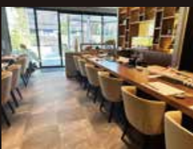
開放的な明るい店内