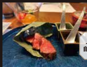
上質な和牛は自家製調味料で